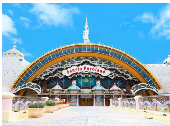
▲サンリオピューロランド

両パークでは、オープン開園35周年を記念したアニバーサリーイベントを実施しており、それぞれのテーマパークならではの特別なコンテンツを展開しています。