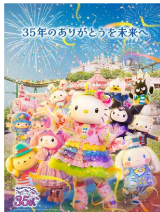
▲Harmonyland 35th Anniversary