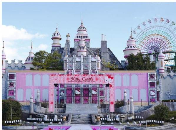
▲サンリオキャラクターパーク ハーモニーランド

日本に二カ所しかないサンリオのテーマパーク「サンリオキャラクターパーク ハーモニーランド」と「サンリオピューロランド」。ハーモニーランドは大分県日出町にある屋外型のテーマパーク、ピューロランドは東京都多摩市にある屋内型のテーマパークです。サンリオキャラクターによるライブショーやアトラクション、グリーティングなど、子どもから大人まで楽しめるコンテンツを展開しています。