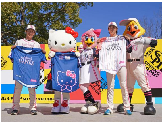
▲宮崎で実施されたユニフォーム発表の様子

5月8日（金）は、当日の観戦チケットをお持ちの方を対象に、「ハローキティ ピンクフル限定ユニフォーム」が配布されました。本ユニフォームは、2月21日（土）に福岡ソフトバンクホークスのキャンプ地である宮崎市生目の杜運動公園の特設ステージにハローキティが登場し、お披露目されたものです。テーマカラーのピンクとは対照的なダークネイビーのユニフォームは、老若男女を問わずどなたでも着用しやすいデザインとなっており、来場者が着用することで会場全体に大きな一体感が生まれ、ピンクフルデーならではの華やかな光景が広がりました。