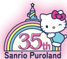
▲Sanrio Puroland 35th Anniversary

※画像素材ご掲載の際は、必ずコピーライトの記載をお願いいたします。