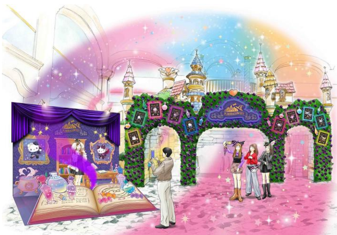
▲3F フォトスポット イメージ

3F フォトスポットには、魔法使いをイメージしたフォトスポットが登場。手をかざすと、不思議なことが起きるかも…？