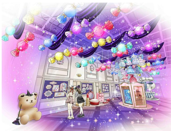
▲レディキティハウス装飾イメージ (メインショー)

期間中はレディキティハウスが、「PUROHALLOWEEN」特別仕様に。 ピアノラホールでは、まるで魔法にかかったような特別なプロジェクションマッピングを開催します。マッピング演出には、ゲストとして、“超ときめき♡宣伝部”のメンバーの声の出演もありますので、ぜひご注目ください。メインショーには、魔法のキャンディや魔法使いのキャラクターたちと一緒に写真を撮れる不思議な鏡のフォトスポットなども登場します。不思議な魔法が盛りだくさんのレディキティハウスをお楽しみください。