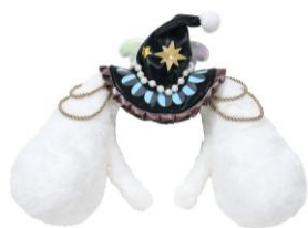
カチューシャ（全3種） 3,190円

「PUROHALLOWEEN」をより楽しむためのカチューシャやぬいぐるみパースはもちろん、魔法使いをイメージしたコスチュームを着たキャラクターたちが描かれた豆本チャームや缶入りアイシングクッキーなどもご用意しました。