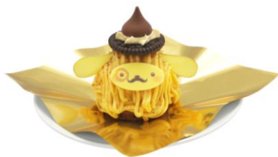
ポムポムプリンのさつま芋と 和三盆のモンブラン 950円