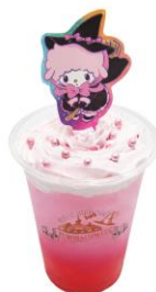
マイルスイートピアノの ピンクカルピスソーダ 900円