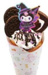
クロミのチョコとココアマジッククレープ 900円

※画像素材ご掲載の際は、必ずコピーライトの記載をお願いいたします。 © 2025 SANRIO CO., LTD. TOKYO, JAPAN 著作 株式会社サンリオ