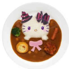
ハローキティの魔女っ子カレー 1,600円

ハロウィーンバージョンのビジュアルの「ハローキティの魔女っ子カレー」や、チョコレートとココアビスケットでできた魔法使いの帽子がかわいい「ポムポムプリンのさつま芋と和三盆のモンブラン」、カルピスソーダにぷるぷるのピーチジェルが舞う見た目も味もキュートな「マイルスイートピアノのピンクカルピスソーダ」、くるくるかわいいチョコロールケーキがのった「クロミのチョコとココアマジッククレープ」など、キャラクターをモチーフにした期間限定メニューが登場。味はもちろん、ビジュアルにもこだわったメニューはSNS映え間違いなしです。