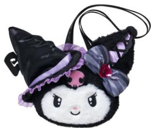
ぬいぐるみパース（全3種） 3,740円