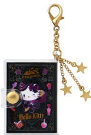
豆本チャーム（全10種） 990円