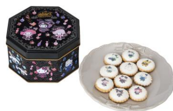
缶入りアイシングクッキー 1,296円