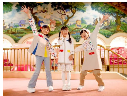
▲お子様のコスチュームイメージ