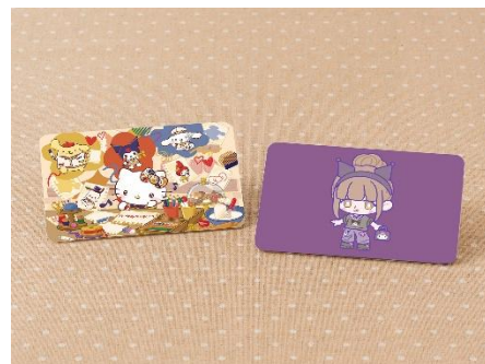
▲キャラクターデザイナー体験イメージ

※画像素材ご掲載の際は、必ずコピーライトの記載をお願いいたします。