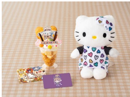
▲各ワークショップ完成イメージ