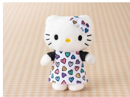
▲衣装デザイナー体験イメージ