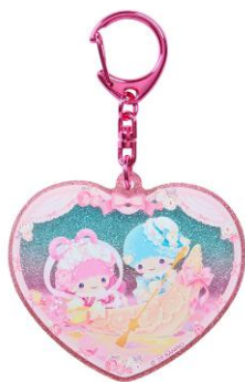
アクリルキーホルダー (全10種) 各880円