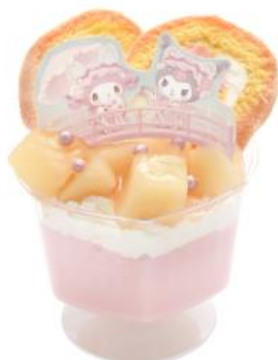
マイメロディ&クロミの ももといちごのミルクプリンパフェ 900円