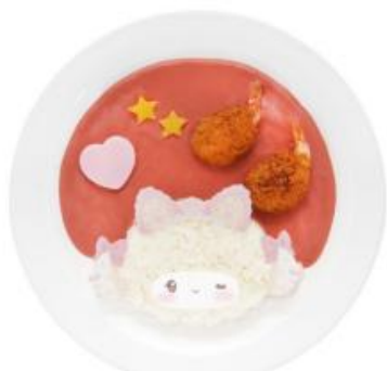
こぎみゆんのまんまる小えびの ピンクカレー 1,540円

味はもちろん、ビジュアルにもこだわったメニューはSNS映え間違いなしです。七夕だけの特別な“食体験”をお届けします。