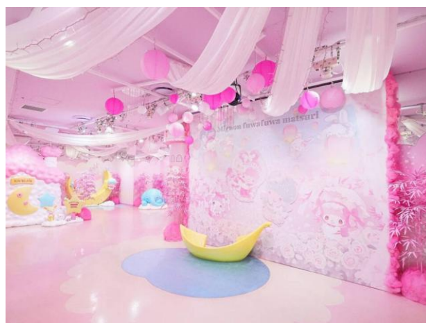
▲Kiki&Lalaトウインクリングスタジオ(今年の装飾イメージ)

昨年も好評をいただいております七夕イベント限定のウィッシングフォトスポットが、今年も幻想的な装飾とともに登場します。追加演出でパワーアップし、星空や短冊など七夕らしいモチーフを背景に、人気キャラクターたちの願いが散りばめられた空間で、物語の一場面のような撮影が楽しめます。