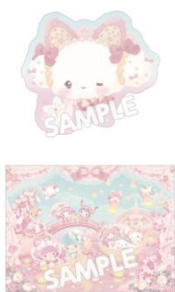
ステッカーセット (全10種) 各550円