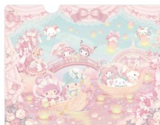
クリアファイル 550円