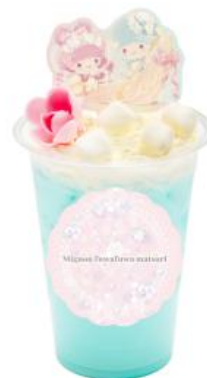
リトルツインスターズの fuwafuwa♡みずいろラッシー 880円