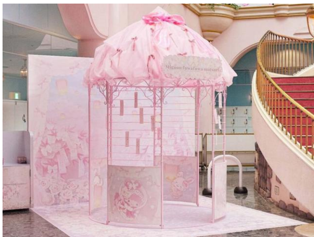
▲ウィッシングスポット(今年の装飾イメージ)