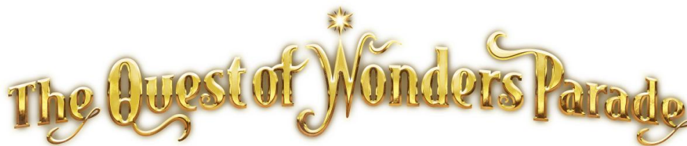
▲メインパレード「The Quest of Wonders Parade」ロゴ

1990年12月7日にオープンしたサンリオピューロランドは、2025年12月7日、35周年を迎えます。35年間、ここではたくさんの“笑顔”に出会うことができました。