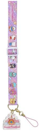
ネックストラップ 全2種 各1,430円