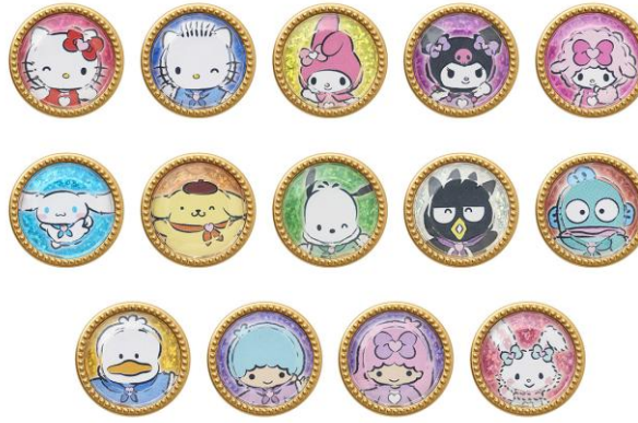
ワンダーリボンライト ジュエル 全14種 各550円