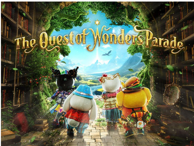
▲「The Quest of Wonders Parade」 ティザービジュアル

10年ぶりの新作となるメインパレード「The Quest of Wonders Parade（ザクエストオブワンダーズパレード）」が12月5日（金）より上演開始します。本パレードは五感を通じて楽しむ“体験型パレード”で、キャラクターたちと一緒に冒険の旅へ出発し、さまざまな試練に立ち向かいます。