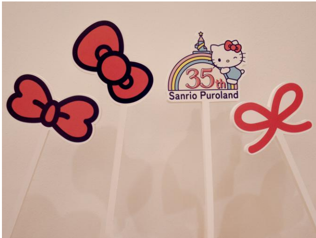
フォトプロップス