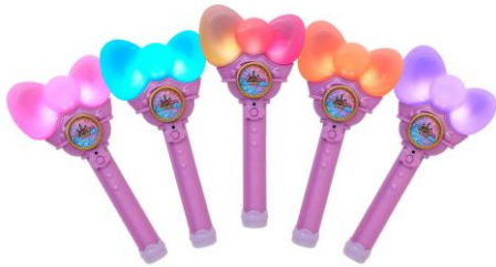
ワンダーリボンライト（点灯イメージ）

パレードがもっと楽しくなること間違いなしの「ワンダーリボンライト」を35周年を記念して販売開始。リボンの形をしたライトはパレードの出演者たちともおそろいのアイテムで、手に持つだけで気分が高まります。ピンクやブルーなどの単色パターンに加え、ワンダーリボンライト同士で“通信”することで出現する特別なカラー、さらにパレードと連動して出現する光り方をあわせるとなんと100以上のパターンで輝きます。