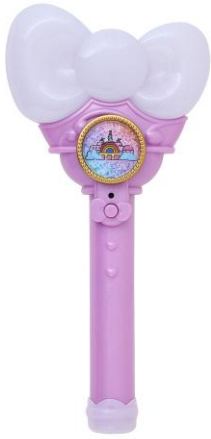
ワンダーリボンライト 3,850円