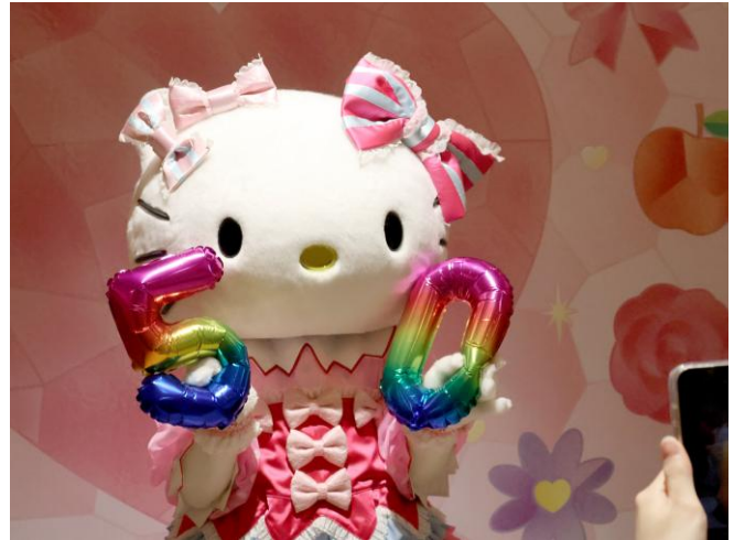
公式SNSで行うカウントダウン投稿イメージ

35周年に向けて、公式SNSでフォトプロップスを活用したカウントダウン企画の実施が決定しました。配信は、50日前の本日（10月16日（木））を初日として、35日前、10日前、5日前、4日前、3日前、2日前、1日前のタイミングで、公式XとInstagramにて配信する予定です。