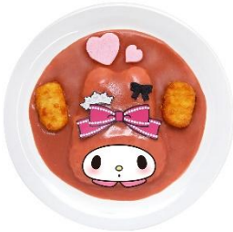
マイメロディのアニバーサリー♡ ナゲットピンクカレー 1,540円

イベントスタートより一足早い1月10日（金）に登場する、期間限定のフードメニューは全部で6種類。マイメロディとクロミをそれぞれモチーフにしたカレーや、お祝いにぴったりなマイメロディ&クロミのアニバーサリーチョコレートケーキを販売します。ケーキの上のっているピューロランド初登場となるマイメロディとクロミのマシュマロがポイントで、購入者にはノベルティとしてポストカードのお渡しも。他にも、丸いフォルムがとってもキュートな、もちもちなスイーツが登場します。