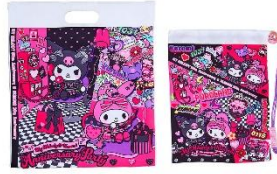
ショッピングバッグ風 ポーチセット 2,090円