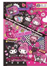
クリアファイル 440円