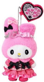
マスコット (マイメロディ) 3,850円

アニバーサリーにふさわしいグッズを多数販売します。アニバーサリーを記念して登場する新作コスチュームを着たマイメロディとクロミのマスコットや、カチューシャが登場。お友達同士でそれぞれのキャラクターのアイテムを身につけて、マイメロディとクロミのように“おそろい”を楽しむのもおすすめです。他にもイベントのメインビジュアルを使用したタオルやクリアファイル、メモ帳などが登場します。