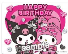
ステッカー (全8種) 各396円