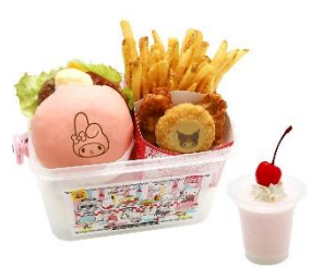
マイメロディ&クロミの アニバーサリー照り焼き バーガーバスケット 2,400円