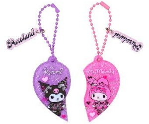
お揃い♡チャーム 990円