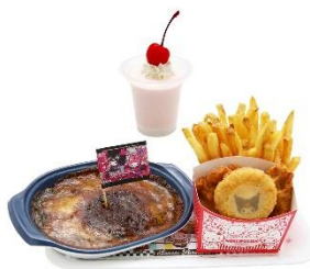
マイメロディ&クロミの アニバーサリービーフドライプレート 2,100円