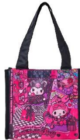
ショッピングバッグミニ 1,100円