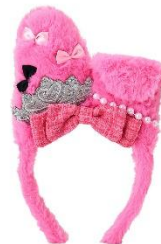
カチューシャ (マイメロディ) 2,970円