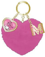
ファーチャーム (マイメロディ) 1,980円