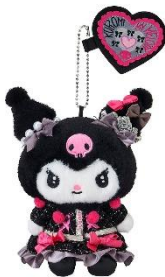
マスコット (クロミ) 3,850円