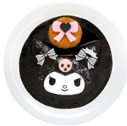
クロミのアニバーサリー♡ メンチカツブラックカレー 1,540円