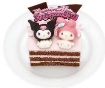
マイメロディ&クロミの アニバーサリーチョコレートケーキ 1,700円