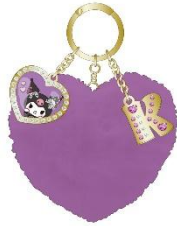
ファーチャーム (クロミ) 1,980円