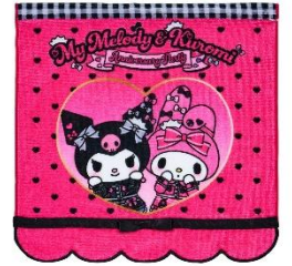
タオル (全4種) 各880円