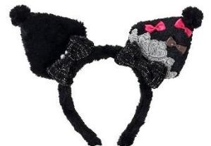
カチューシャ (クロミ) 2,970円