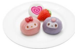
アニバーサリーもちもち ～ストロベリー & チョコ～ 680円