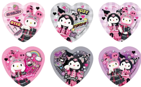
缶バッジ (全6種) 660円