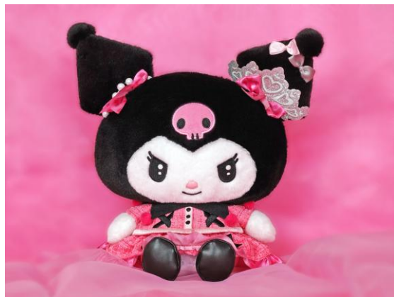
My Melody & Kuromi Anniversary Party クロミアニバーサリードール 7,150円

10月31日のクロミお誕生日を記念して、「My Melody & Kuromi Anniversary Party クロミアニバーサリードール」が登場。クロミが直接アニバーサリードールをお渡しする「クロミアニバーサリードールお渡し会」も特別に実施します。お渡し会では写真撮影もお楽しみいただけます。