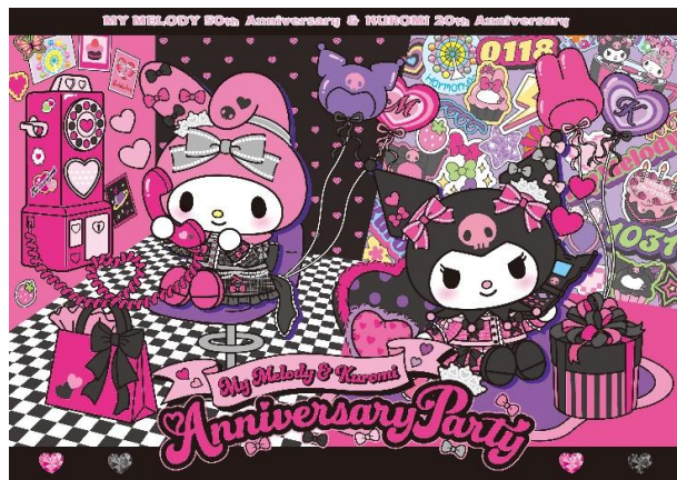
『My Melody & Kuromi Anniversary Party』 ハーモニーランドイベントビジュアル