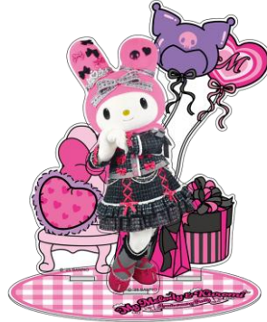
アクリルスタンド (マイメロディ) 1,980円