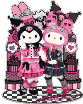
アクリルスタンド (マイメロディ&クロミ) 1,980円