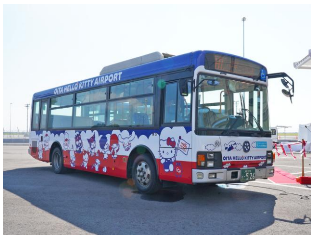
“ハーモニーライナー” 外装