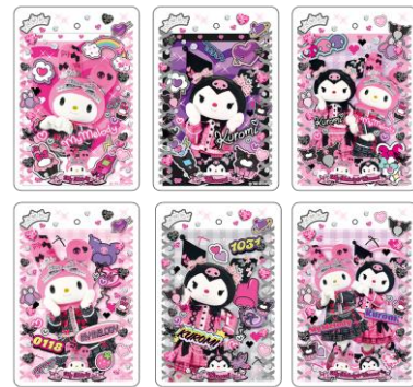
シークレットカード付き硬質カードケースキーホルダー (全6種) 990円