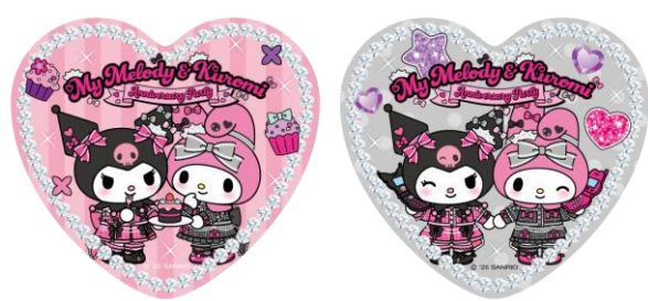
ノベルティコースター (対象店舗) マイメロディ&クロミ カフェ テラス