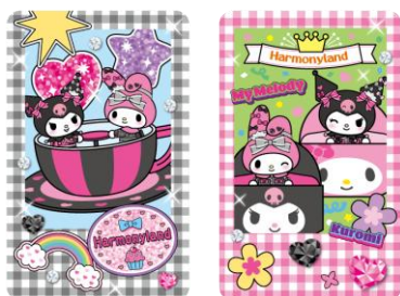
ノベルティカード (対象店舗) ハーベストテーブル、サーカスキッチン