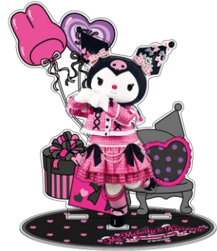
アクリルスタンド (クロミ) 1,980円