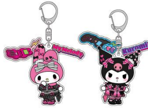
アクリルキーホルダー