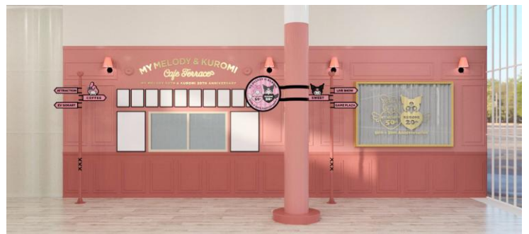
MY MELODY & KUROMI Cafe Terrace カフェ側イメージ

1月17日よりホワイトバースクエアのハッピーカフェを、マイメロディとクロミ仕様にリニューアルし『MY MELODY & KUROMI Cafe Terrace (マイメロディ&クロミ カフェテラス)』として展開します。マイメロディとクロミのぬいぐるみをハート型に飾ったフォトスポットや、シルエット型ミラーなど写真や動画撮影も楽しめる店内では、ふたりのアニバーサリーをお祝いする“おそろい”メニューなどを販売します。