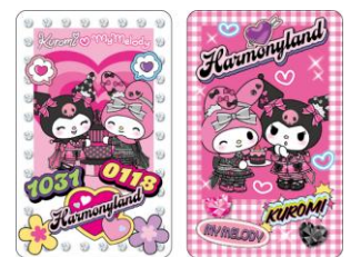
ハーベストテーブル・サーカスキッチン 配布ノベルティ チエキ風カード