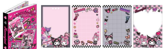
パタパタメモ(メモ4柄)