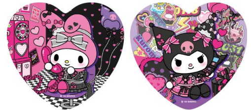
MY MELODY & KUROMI Cafe Terrace 配布ノベルティ ハート型コースター