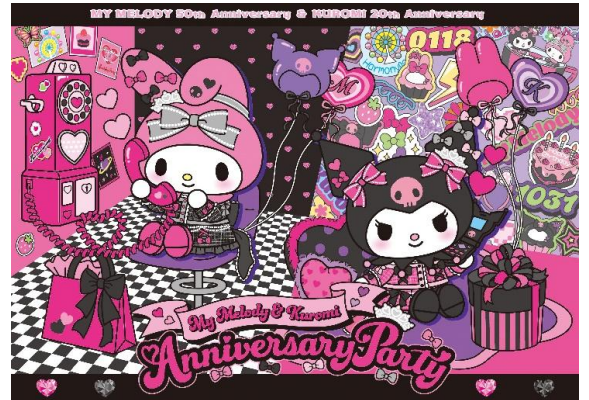
「My Melody & Kuromi Anniversary Party」 ハーモニーランドイベントビジュアル

※画像素材ご掲載の際は、必ずコピーライトの記載をお願いいたします。