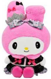
マイメロディ アニバーサリードール