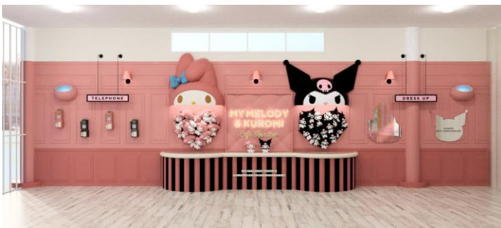
MY MELODY & KUROMI Cafe Terrace キャラクター側イメージ