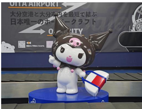
国内線手荷物受取所 (クロミ)