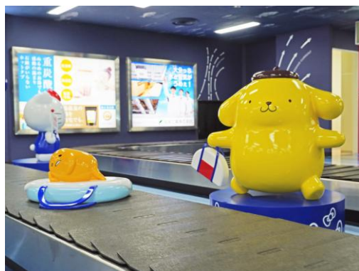
国内線手荷物受取所 (ポムポムプリン)