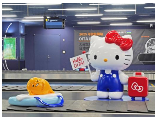
国内線手荷物受取所 (ハローキティ&ぐでたま)