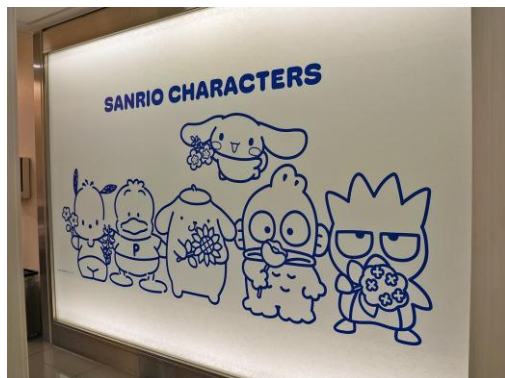
到着ロビートイレ②

※画像素材ご掲載の際は、必ずコピーライトの記載をお願いいたします。 © 2025 SANRIO CO., LTD. TOKYO, JAPAN 著作 株式会社サンリオ