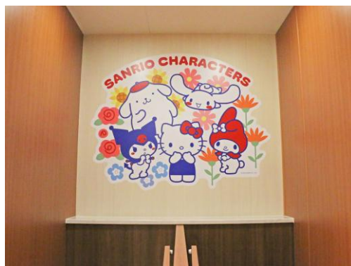
到着ロビートイレ①