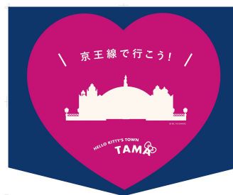
《オリジナルヘッドマーク》