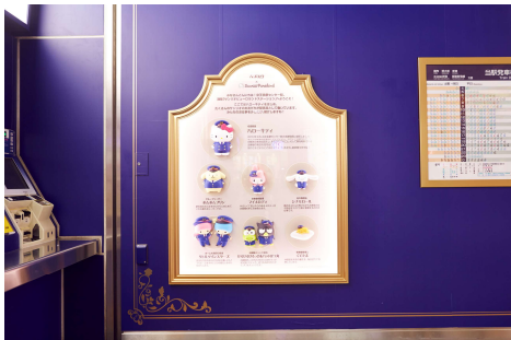
《駅係員紹介スポット》