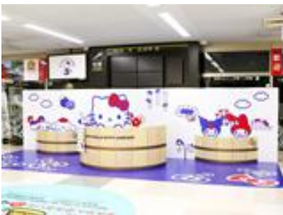
到着ロビーフォトスポット