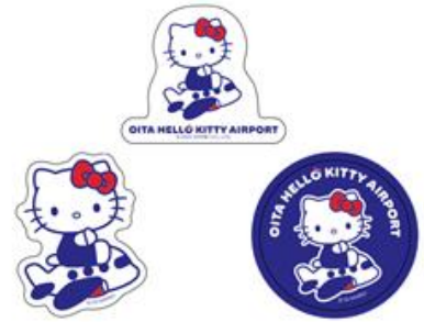
ステッカー（全3種） 各396円