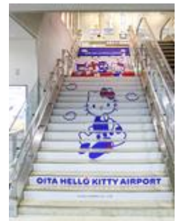
国内線ビル中央階段