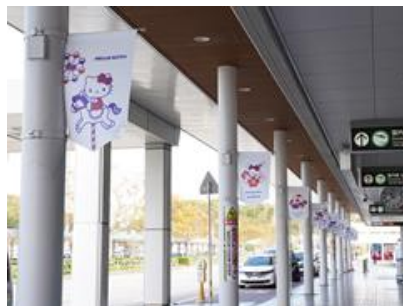
国内線ビル玄関フラッグ