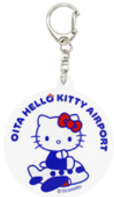
アクリルキーホルダー 660円

販売場所：大分空港 国内線ターミナル2階 空の駅「旅人」（たびと）、ハーモニーランド内ショップ「カントリーマーケット」