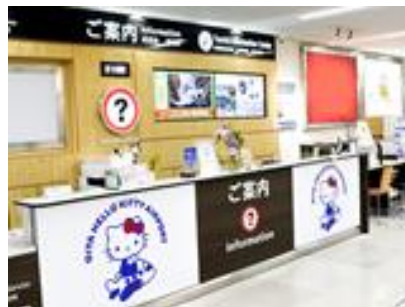
国内線1階インフォメーション