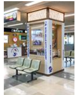
到着ロビー柱装飾