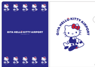
クリアファイル 440円