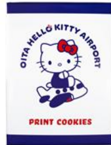
プリントクッキー 756円