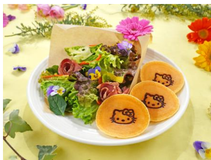
ローストビーフのブーケサラダ