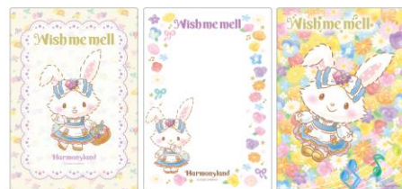
シークレットカード