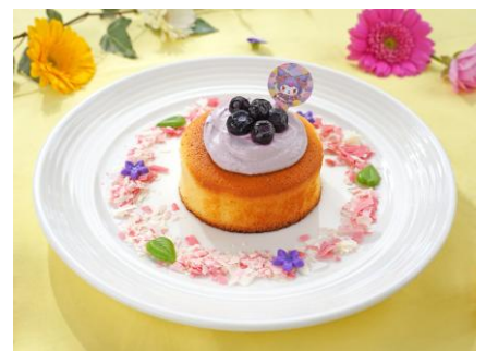
フラワーベリーパンケーキ