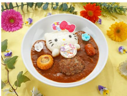
キティのフラワーカレー

『Harmonyland Flower Fantasy』の開催期間中は、見た目も華やかな期間限定フードが登場します。お花をイメージした「キティのフラワーカレー」や、花束に見立てた「ローストビーフのブーケサラダ」など、春気分を盛り上げるメニューがラインアップ。さらに、花びらのようなチョコをトッピングした「フラワーベリーパンケーキ」や、食べ歩きにもぴったりの「フラワープチホットケーキ」、カラフルな「ゼリークリームソーダ」など、写真映えるメニューもお楽しみいただけます。