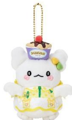
マスコット（全7種） 各2,750円