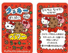
ラッキーカード（全7種） 各220円

チエゴシムの特徴である「ラッキーカード」やアクリルキーホルダー、持ち歩いて癒されるアイテムが多数登場！また、ライブキャラクターとお揃い衣装の期間限定のマスコットも登場します。