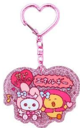
アクリルキーホルダー（全7種） 各880円