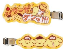
アクリルヘアクリップ（全7種） 各990円